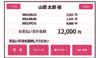
④支払方法選択画面